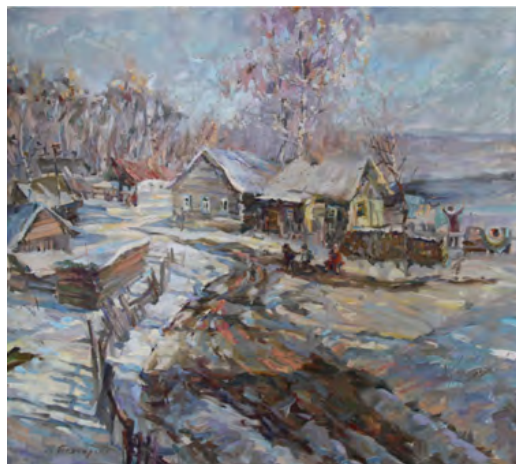
Каникулы. 2016. Холст, масло. 90×80 см