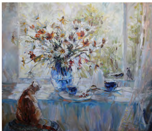
Гости. 2014. Холст, масло. 70×80 см

ким художественным вкусом и мастерством, позитивным отношением к окружающему миру. Работы художницы находятся в Минусинской городской картинной галерее, в Минусинском музее, в частных коллекциях Новосибирска, Москвы, Омска, Красноярска, Минусинска, Абакана, Германии и Швеции.