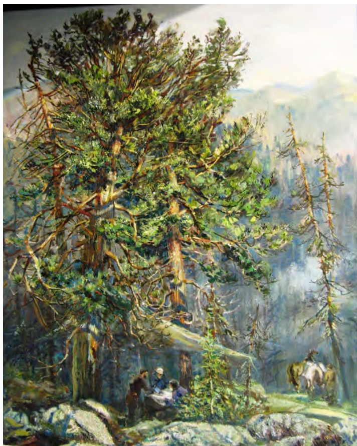
Ергаки. 2007. Холст, масло. 130×100 см

Пейзажи, натюрморты и портреты Ирины Бехтеревой отличаются своеобразным творческим стилем, высо-